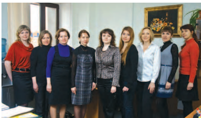
Помощники судей гражданской коллегии

В начале 2010 г. подготовлены обзоры судебной практики по рассмотрению споров, вытекающих из отношений перевозки грузов железнодорожным транспортом, а также по применению норм ГК РФ об исковой давности.