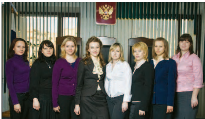
Помощники судей административной коллегии

связанным с защитой права собственности; по делам, связанным с применением законодательства об исполнительном производстве; по практике применения норм АПК РФ о принятии обеспечительных мер; по делам об обороте земельных долей и земельных участков из земель сельскохозяйственного назначения; по рассмотрению споров, связанных с участием антимонопольных органов; по применению главы 29 НК РФ «Налог на игорный бизнес»; об оценке доказательств при определении обоснованности налоговой выгоды.