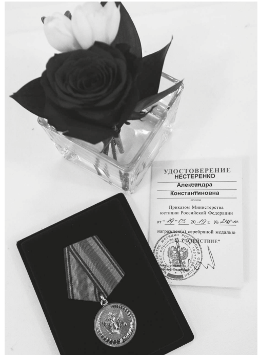
Серебряная медаль Минюста России

го лица в рамках его гражданско-правовой ответственности за действия юридического лица 1 . Спикер также обратил внимание на сделанный Судом в марте 2019 г. вывод о необходимости проверять разумность и осмотрительность действий (бездействия) всех лиц, которые повлияли на возникновение и размер расходов по делу о банкротстве, включая действия (бездействие) налогового органа 2 . Вспомнили и позицию 2004 г. 3 о праве юридического лица самостоятельно принимать стратегические и экономические решения.