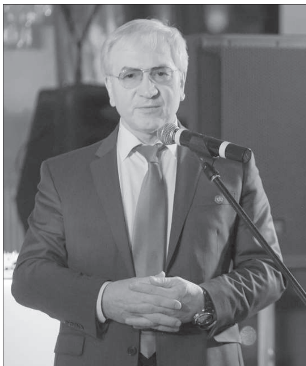
Гадис Гаджиев , судья Конституционного Суда РФ

13 декабря 2018 г. в самом сердце Москвы Объединение Корпоративных Юристов (ОКЮР) провело Торжественный прием, посвященный Дню Конституции РФ и 15-летию ОКЮР, — вечер, наполненный улыбками, искренней радостью и теплыми словами.