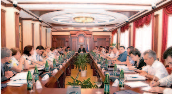
Заседание Научно-консультативного совета при ФАС СКО

Кавказского судебного округа, председатели судебных составов, судьи ФАС СКО, арбитражных апелляционных судов и арбитражных судов субъектов Российской Федерации, входящих в Северо-Кавказский юрисдикционный округ, а также научные работники юридической специальности. Заключение Научно-консультативного совета носят рекомендательный характер и доводятся до сведения всех заинтересованных лиц.