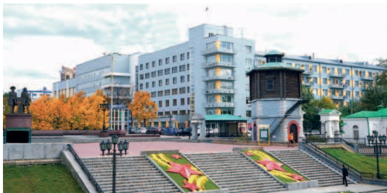
Здание Арбитражного суда Уральского округа. 2015 г.

На сегодняшний день общая площадь помещений, занимаемых судом, составляет около 5000 кв. м.