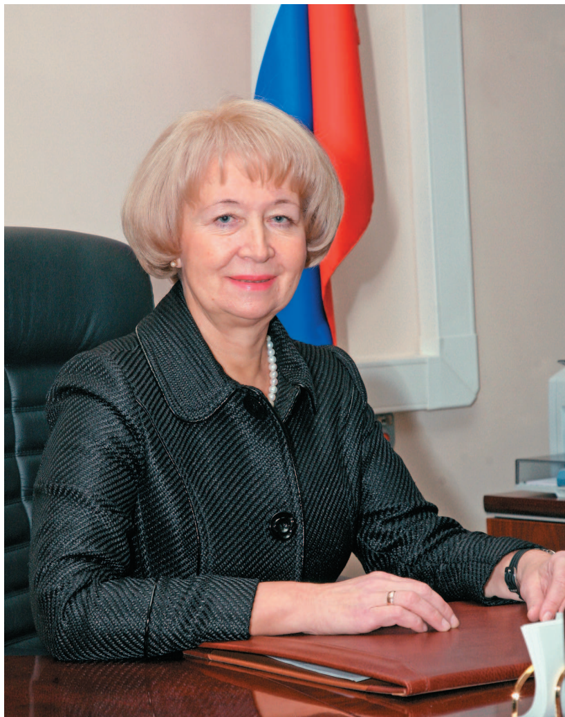
Наталья Александровна ШУРШАЛОВА , заместитель председателя ФАС Московского округа

Родилась 6 мая 1949 г. в г. Свердловске. В 1970 г. окончила Свердловский юридический институт. С 1970 по 1981 г. работала в государственных организациях в должности юрисконсульта. С 1981 по 1985 г. дважды избиралась народным судьей Черемушкинского районного народного суда г. Москвы. В марте 1985 г. избрана членом Московского городского суда, в феврале 1995 г. назначена членом его Президиума. В 1995 г. приступила к исполнению обязанностей судьи ФАС Московского округа, в августе 1997 г. назначена председателем судебного состава. С ноября 2003 г. занимает должность заместителя председателя ФАС МО. Имеет высший квалификационный класс судьи, почетное звание «Заслуженный юрист Российской Федерации». Награждена медалью «За заслуги перед судебной системой Российской Федерации» II степени.